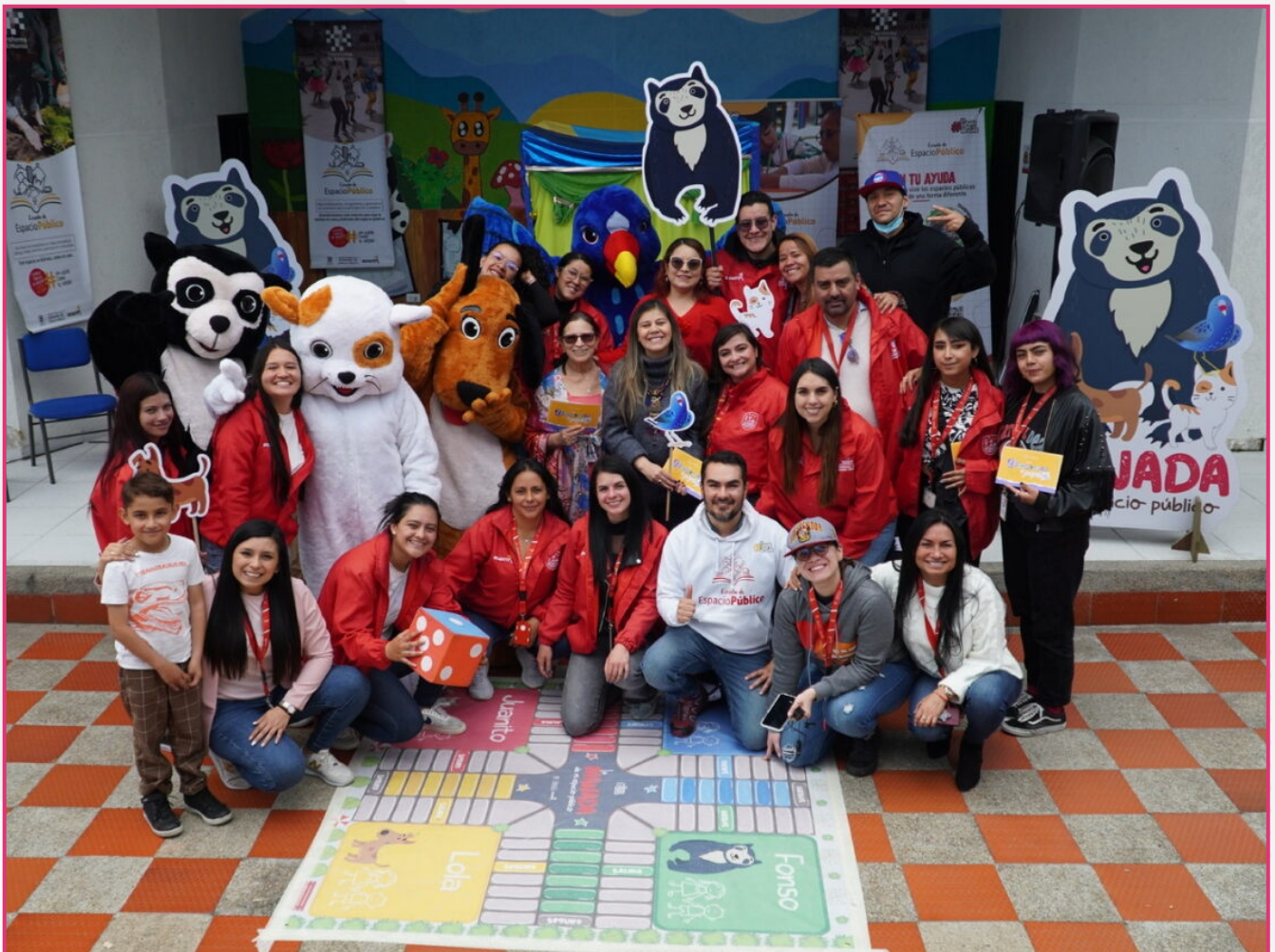
Lanzamiento cuento infantil 'La Montaña de Popó'. Colegio Tomás Carrasquilla. Localidad Barrios Unidos. Marzo 2023.