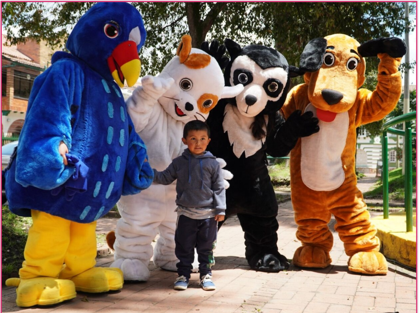
Padrinos del Espacio Público. Parque El Pony. Localidad de Teusaquillo. Diciembre 2022.