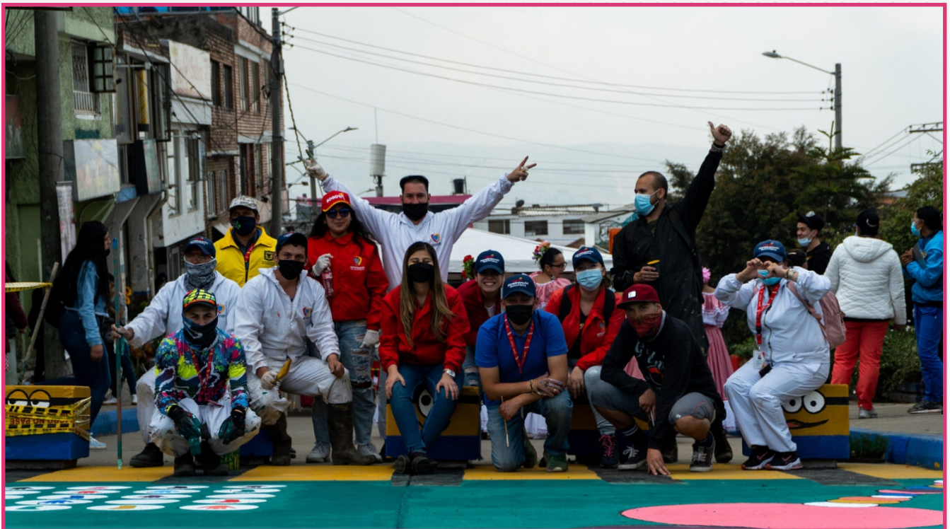
Transforma tu Entorno. Barrio Los Libertadores. Localidad San Cristóbal. Noviembre 2021.