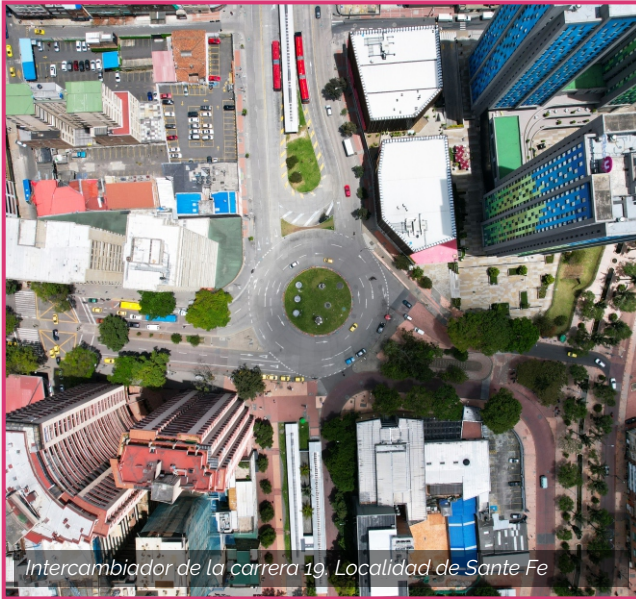
Intercambiador de la carrera 19. Localidad de Santa Fe