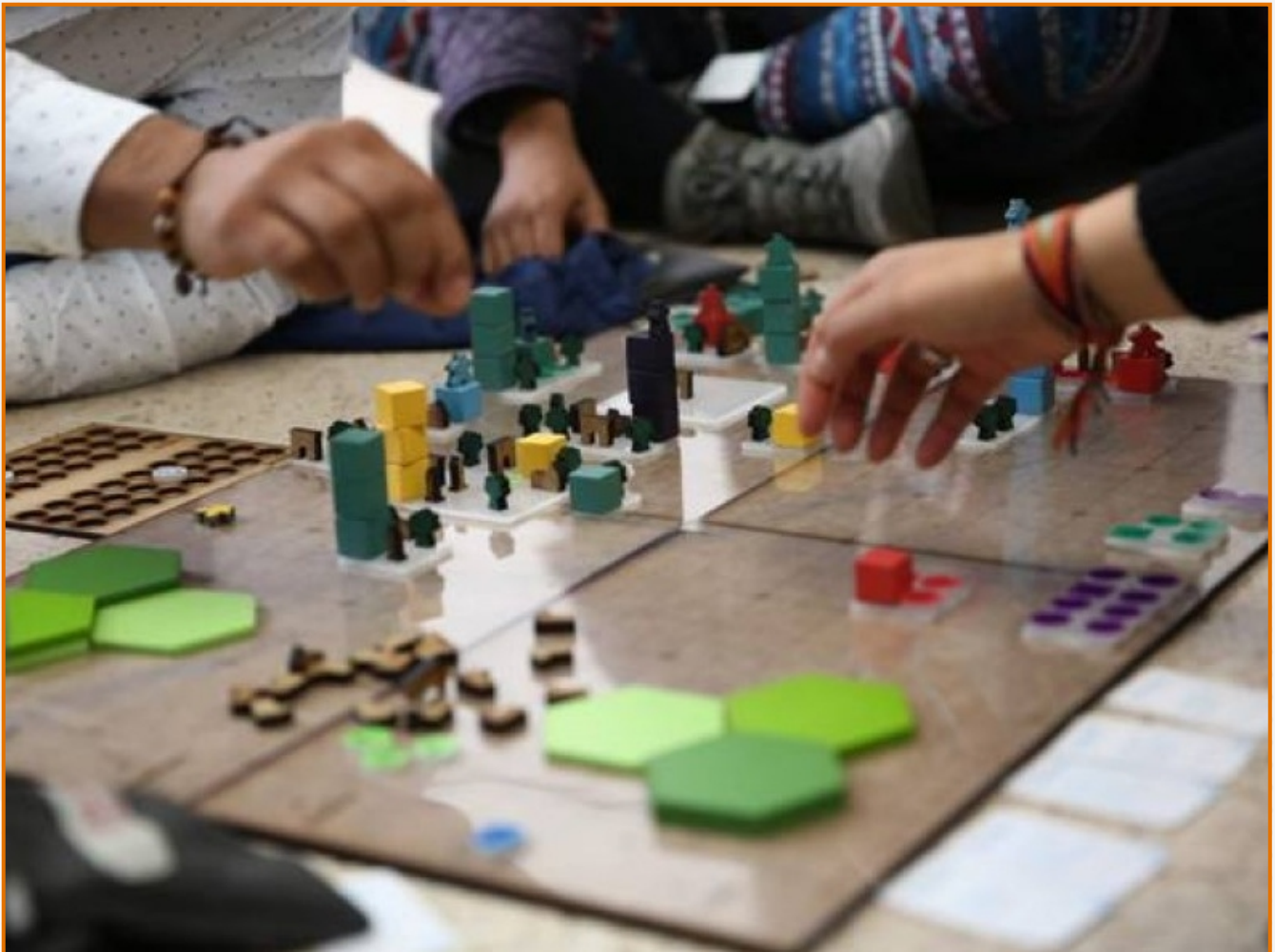
Implementación juego de mesa Antrópolis.