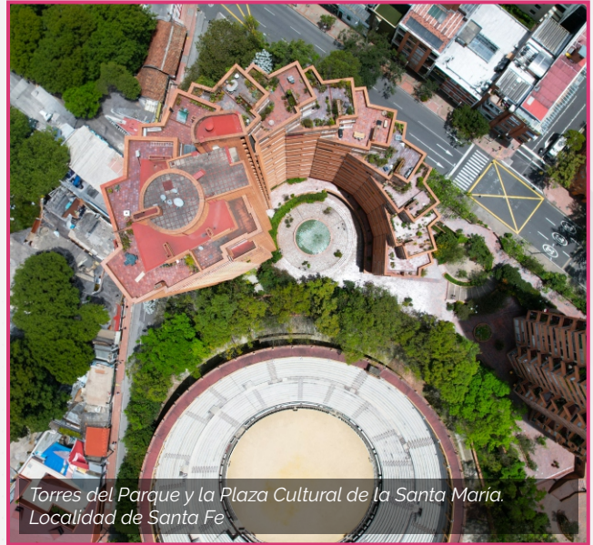
Torres del Parque y la Plaza Cultural de la Santa María. Localidad de Santa Fe