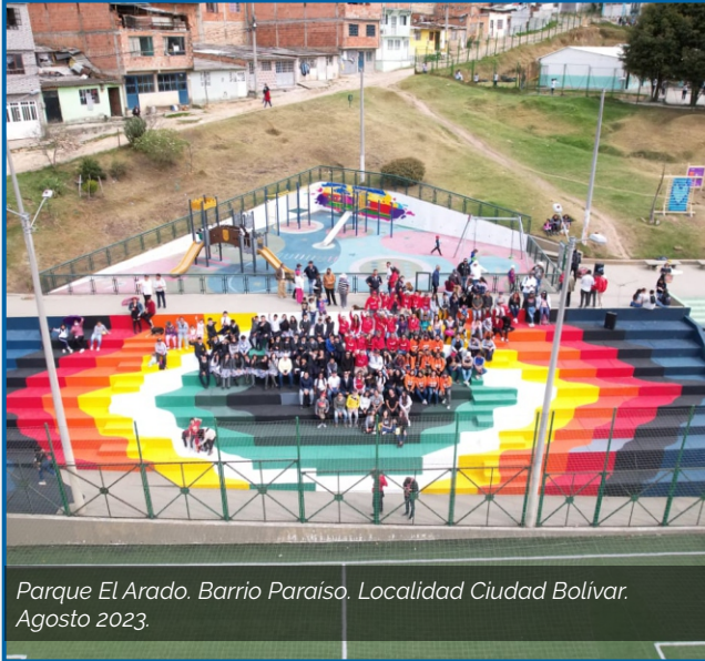
Parque El Arado. Barrio Paraíso. Localidad Ciudad Bolívar. Agosto 2023.