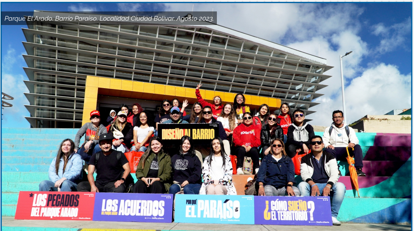
Parque El Arado. Barrio Paraíso. Localidad Ciudad Bolívar. Agosto 2023.