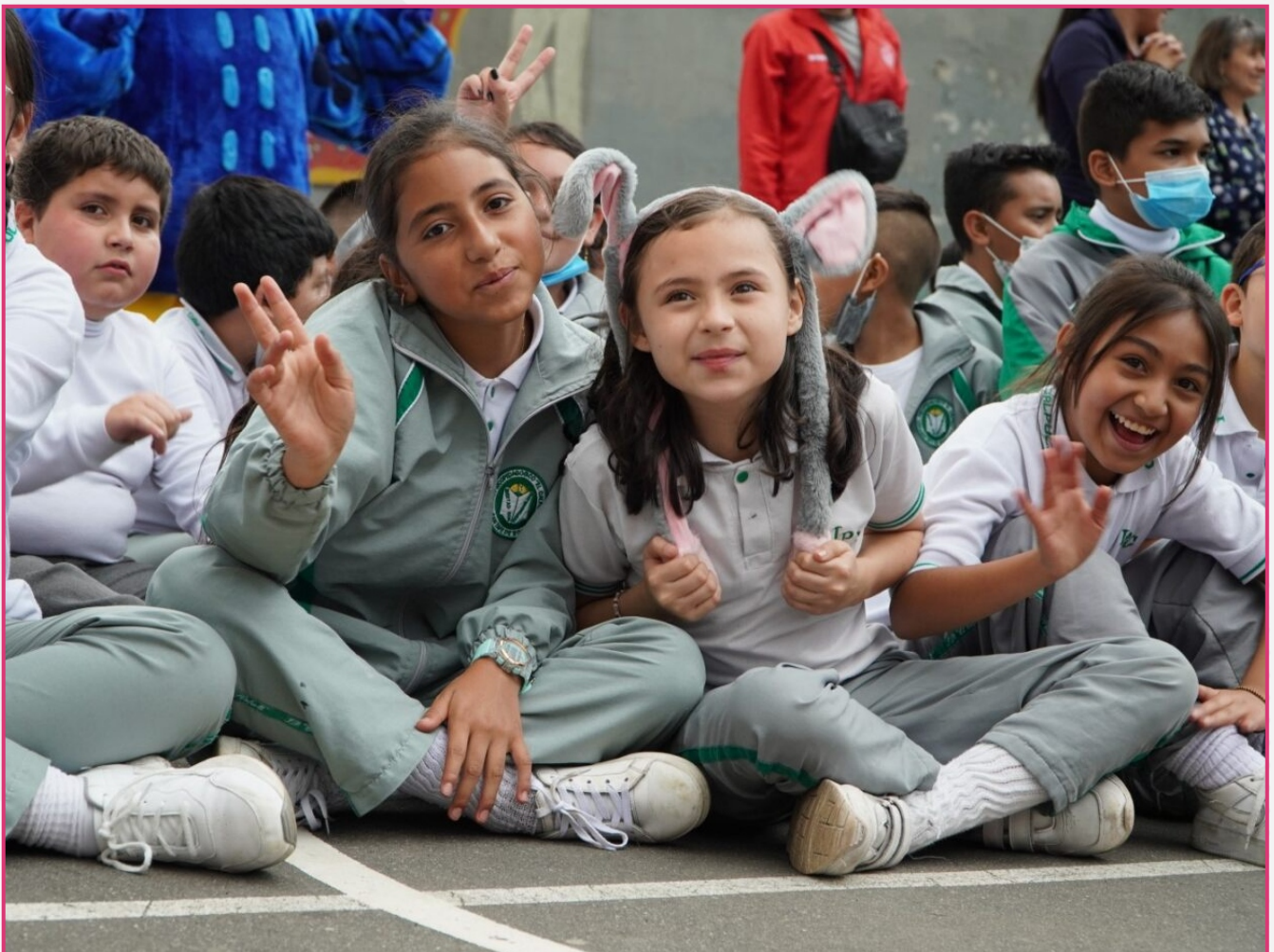
Aulas Al Aire. Institución Educativa Distrital El Calpulli. Localidad Fontibón. Octubre 2022.