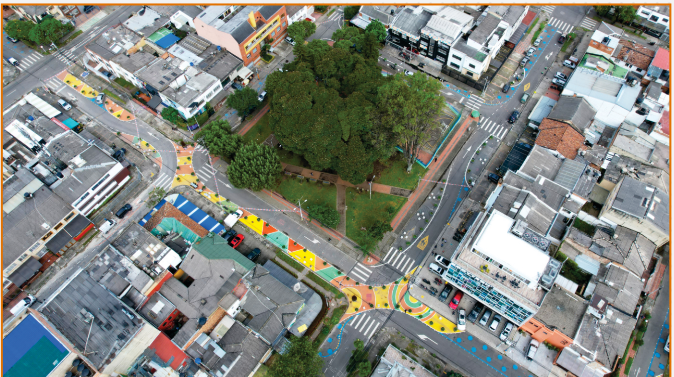
Urbanismo Táctico en el barrio y parque San Felipe. Localidad Los Mártires.