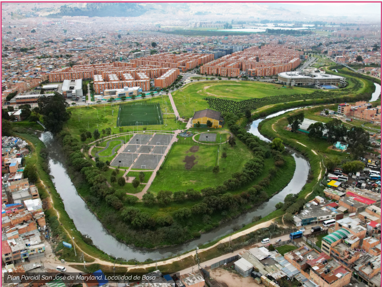
Plan Parcial San José de Maryland. Localidad de Bosa