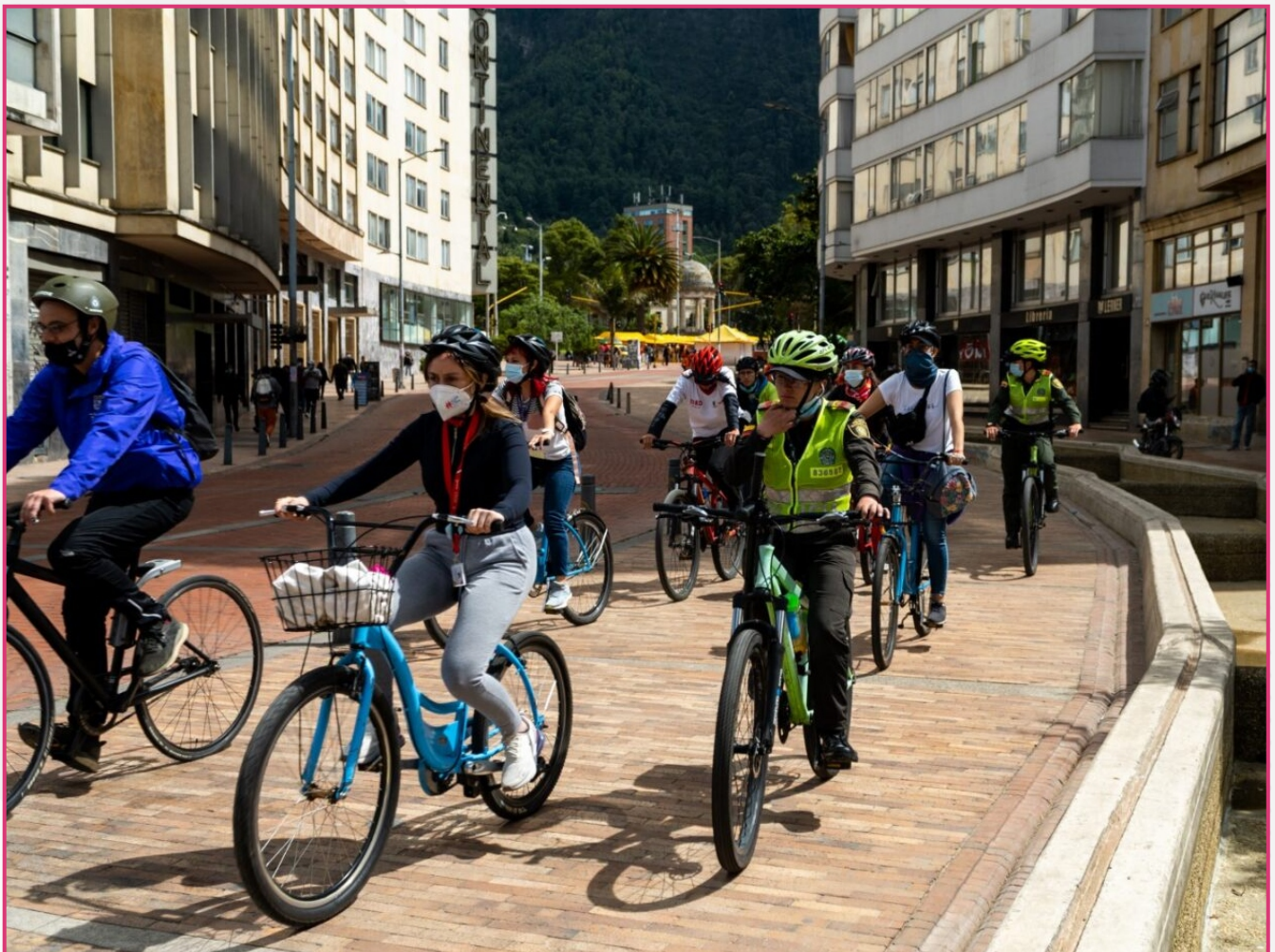
Mi Espacio Mi Bici. Localidad La Candelaria. Diciembre 2021.