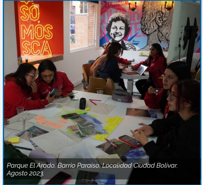
Parque El Arado. Barrio Paraíso. Localidad Ciudad Bolívar. Agosto 2023.