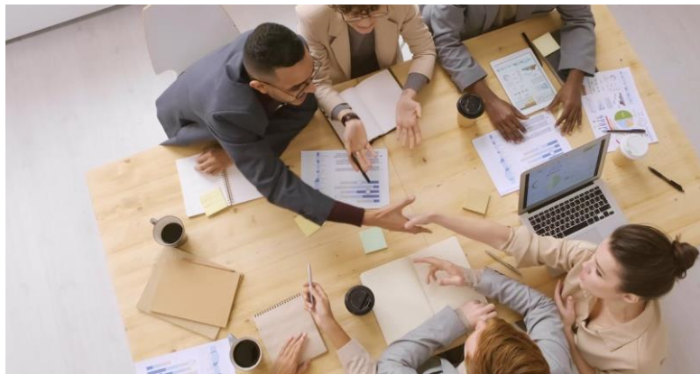
Img. 1. Nombre de la imagen

En esta sección se debe detallar de forma específica el tema a abordar con evidencias que se materializarán en gráficas las cuales deben nombrarse de la siguiente forma: